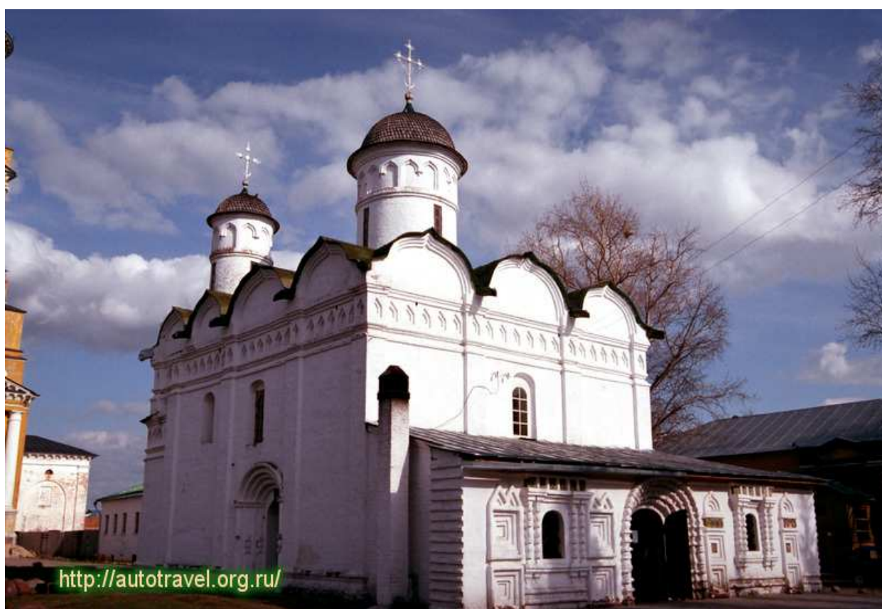
Ризоположенский собор. Современное фото.

После одного искушения, когда святая усердно молилась Господу о помощи против духов злобы, пред её очами разверзлась земля и пропасть поглотила всю силу вражью. С тех пор дьявол уже не искушал преподобную.