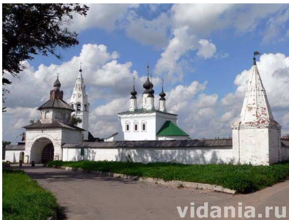
Вид на Суздаль. Современное фото