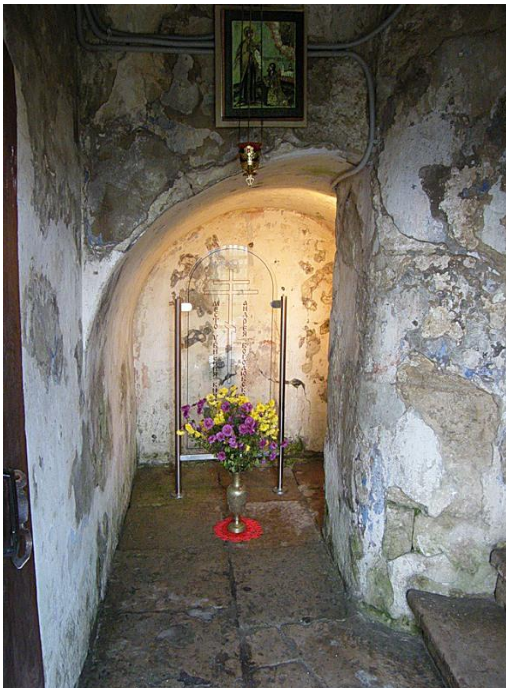
Место убийства святого князя Андрея Боголюбского

тихо, никто не пришел на помощь святому страдальцу. Тогда злодеи вновь осмелели, зажгли свечи и по кровавому следу пошли искать свою жертву. Молитва была на устах святого Андрея, когда его вновь обступили убийцы.