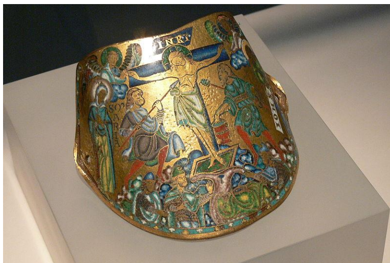
В Лувре хранятся т.н. наплечники Андрея Боголюбского

Святой князь Андрей Боголюбский канонизирован Русской Православной церковью около 1702 года в лике благоверного. Память 4 (17 июля). Мощи Андрея Боголюбского находятся в Андреевском приделе Успенского собора во Владимире.