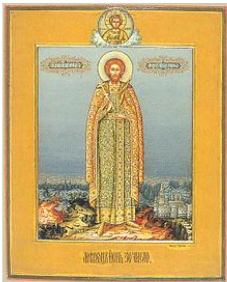
Икона святого князя Андрея Боголюбского