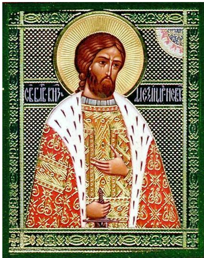
Святой благоверный великий князь Александр Невский