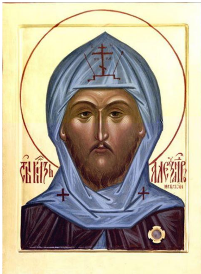
Икона святого князя Александра Невского с частицей святых мощей