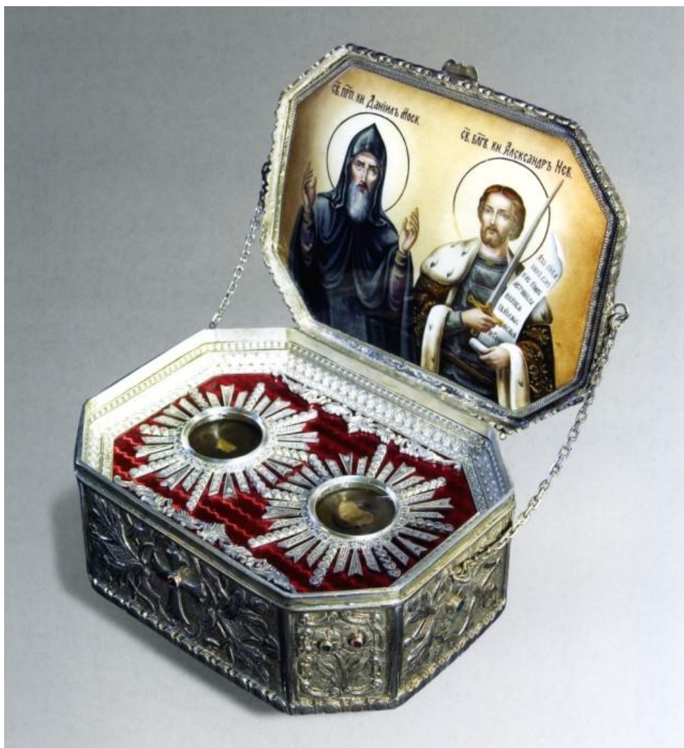
Ковчег с мощами святых благоверных князей Александра Невского и Даниила Московского